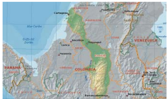
Figura 1a. Ubicación del Departamento de Bolívar.

Para la realización de este estudio se establecieron cuatro puntos de muestreo en diferentes muelles de la Bahía de Cartagena (figuras 1a y 1b) correspondientes al muelle Néstor Pineda de ECOPETROL, CONTECAR, Sociedad Portuaria y El Bosque. Adicionalmente se muestrearon cuatro buques de tráfico internacional que arribaron a la bahía (Vera B, Sporades, Vitoria y Panam).