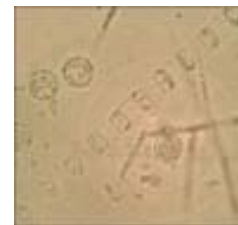
Figura 5. Skeletonema costatum (40x).

El ecosistema ha evolucionado generando cambios que no han sido registrados en cuanto a la comunidad fitoplanctónica, por lo tanto se recalca la importancia de este proyecto al establecer una línea base de la información existente y actual de la bahía. Se debe establecer un puerto de inspección con el propósito de determinar la biodiversidad nativa y la presencia, ausencia, distribución, abundancia y estacionalidad de las especies marinas