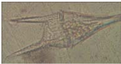
Figura 4. Ceratium furca (40x).