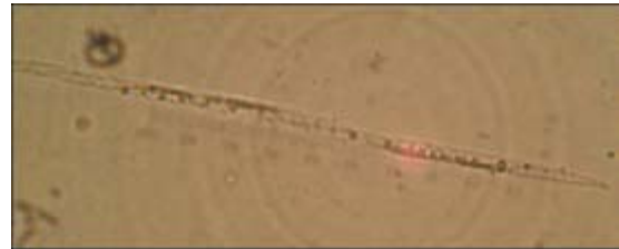
Figura 3. Pseudonitzschia sp. (40x).