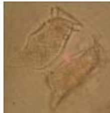
Figura 2. Dinophysys caudata (40x).

Algunas de las especies citadas en esta fase III del proyecto como Dinophysys caudata (figura 2), Pseudonitzschia sp. (figura 3), Ceratium furca (figura 4), y Skeletonema costatum (figura 5), han sido registradas como causantes de enfermedades tales como intoxicación diarreaica por marisco o por ácido domoico e impactos al ecosistema marino, por producción de hipoxia y anoxia, como se cita en la lista de referencias taxonómicas de la Comisión Oceanográfica Intergubernamental (COI) de algas planctónicas tóxicas de 2002. Esto indica que el agua de la Bahía de Cartagena presenta algunas especies que pueden llegar a ser nocivas en éste y otros ecosistemas, dependiendo de las características ambientales bajo las cuales se desarrollen.