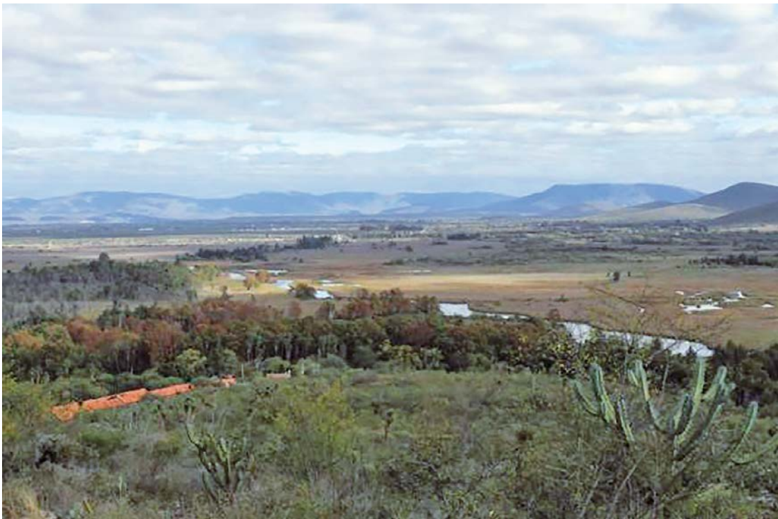
Figura 8. Vista del manantial La Media Luna desde el ascenso a la Loma 1 del cerro El Jabalí. (Foto: Roberto Ruiz).

Finalmente, siguiendo a Lara y Estrada (2020:39) respecto al simbolismo del paisaje ritual del manantial, quizás la facilidad de observar el fondo y su peculiar relieve tuvo como resultado la concepción de otro mundo, al cual se ingresaba o se tenía contacto a través del espejo de agua.