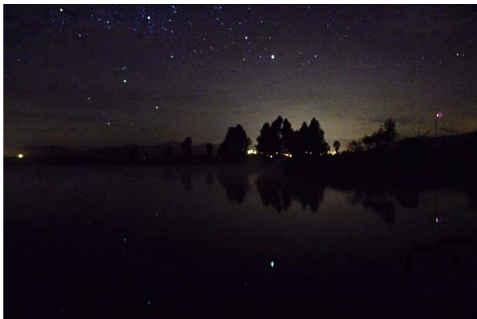
Figura 2. Reflejo de la bóveda celeste en la superficie del manantial.

único sitio en el que han sido localizados restos prehispánicos; además, es uno de los cuerpos de agua más cristalinos en todo el país, particularidad que permite observar desde la superficie el fondo, sumado a esto las aguas que lo componen son termales y cuando las condiciones atmosféricas lo permiten es posible observar vapor sobre su superficie. De forma complementaria, dadas las características que dan cuerpo al manantial, por las noches, cuando no hay corrientes de viento que muevan el agua y si el cielo se encuentra despejado, es posible ver el reflejo de la esfera celeste, esto es interesante pues el espejo estaba asociado con la profecía en el México antiguo (Figura 2). De esta manera se observan distintos elementos en el espacio del manantial que al ser percibidos por los grupos que frecuentaron el sitio, dan sentido al paisaje ritual que formularon para entablar conexiones con otras entidades y lugares.