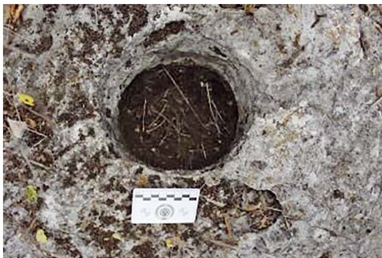
Figuras 4. Poza 3 (posible xicalli).