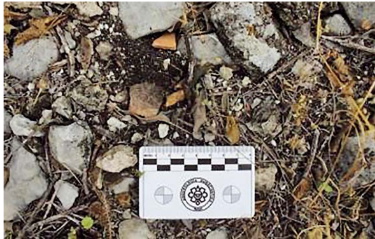
Figura 5. Tepalcates asociados a la Poza 1. (Foto: Roberto Ruiz).