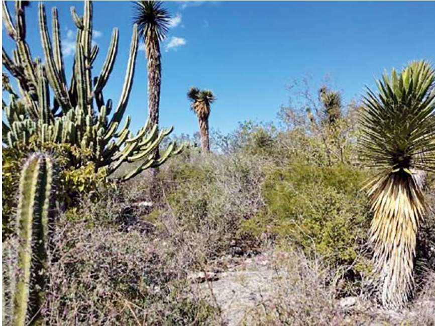
Figura 3. Vegetación en la Loma 2, misma que predomina en todo el cerro El Jabalí. (Foto: Roberto Ruiz).

mencionados se encuentra una oquedad desde la que brota aire que va de tibio a caliente, cuyas dimensiones aproximadas son 60 cm de largo, 50 cm de alto y se desconoce la profundidad que pudiera llegar a tener (figuras 6 y 7).