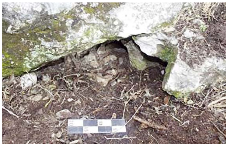
Figura 7. Vista desde enfrente del Respiradero 1 en la Loma 1 del Cerro El Jabalí. (Foto: Roberto Ruiz).