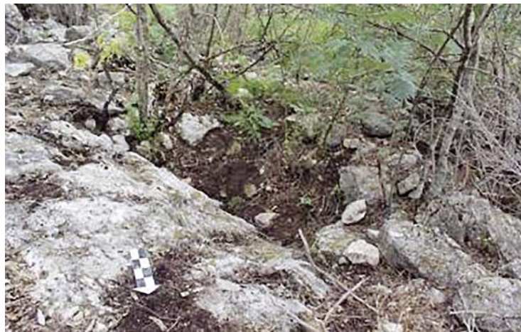
Figura 6. Vista general del área en donde se encuentra el respiradero 1 en la Loma 1 del cerro El Jabalí..